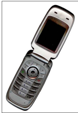
Figura 2. Ejemplo de una imagen con resolución aceptable.

No hay un límite en cuanto a la cantidad máxima de imágenes permitidas. Sin embargo, límitese a incluir las imágenes y ecuaciones más esenciales o novedosas como se aprecia con la figura 2.